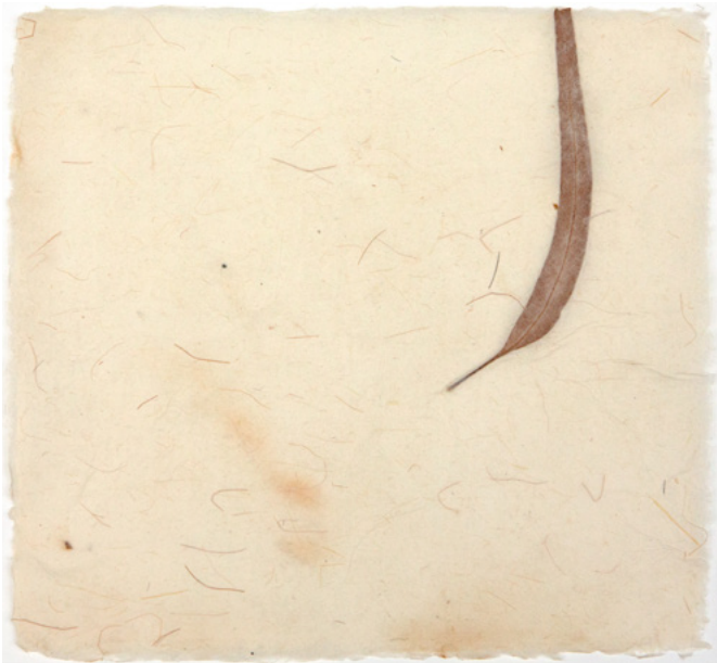
Therese Weber Mikroansicht II / Micro View II Doppelschichtig geschöpfte Maulbeerbaumfasern mit Einschlüssen von Rohrglanzgras. Kreidezeichnung / Double-layered scooped mulberry fibres with inclusions of reed canary grass. Chalk drawing 29 x 29 cm 1969