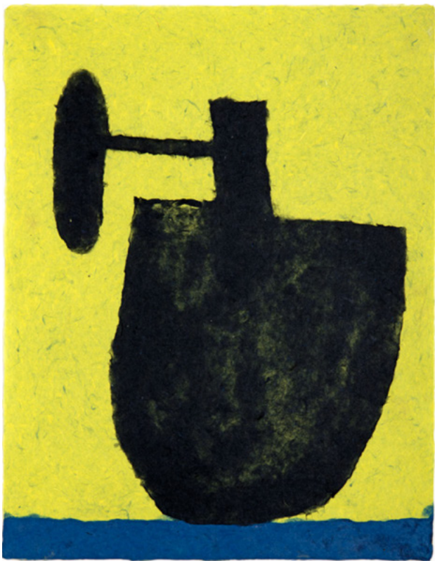
Therese Weber Nördlich von Al-Ula I / North of Al-Ula I Washi, gefärbte und gegossene Maulbeerbaum- fasern / Washi, colored and cast mulberry fiber 64 × 49 cm 2023

for print-size images (300dpi), please contact us für Bilder in Druckgröße (300dpi), bitte kontaktieren Sie uns