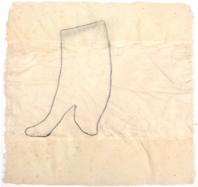
Therese Weber Mikroansicht VI / Micro View VI Doppelschichtig geschöpfte Maulbeerbaumfasern mit Einschlüssen von Rohrglanzgras. Kreidezeichnung / Double-layered scooped mulberry fibres with inclusions of reed canary grass. Chalk drawing 29 x 29 cm 1969