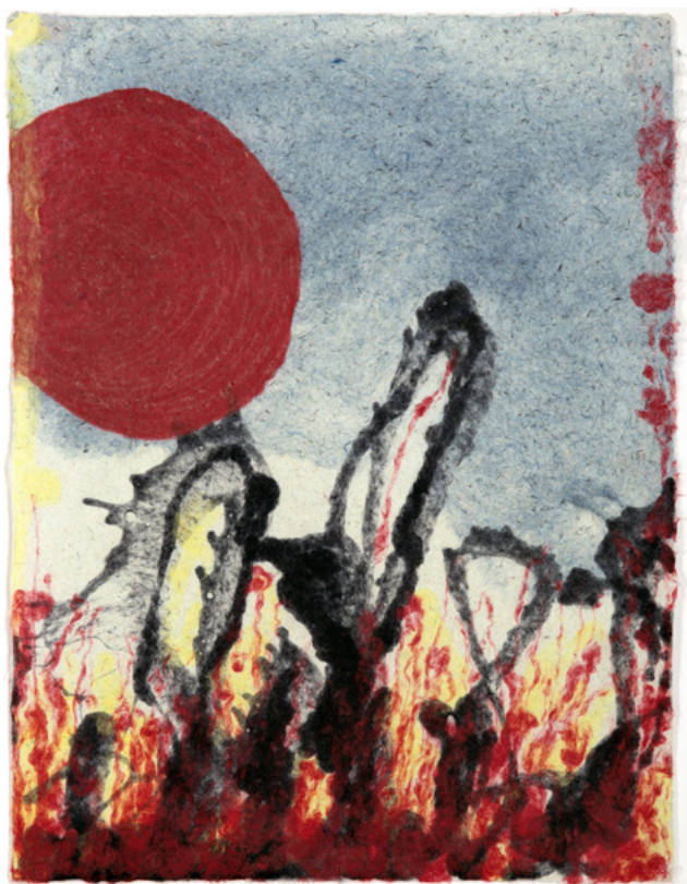
Therese Weber Japanisches Inselreich I / Japanese Island I Washi, geschöpfte und gegossene Maulbeer- baumfasern / Washi, handmade and cast Mul- berry Fiber 64 × 49 cm 2023